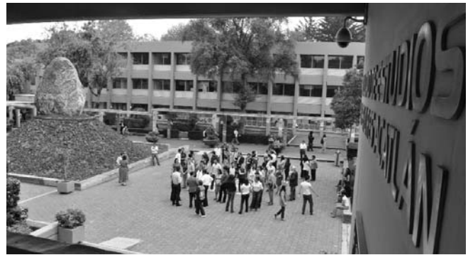
Personal reunido en la explanada del edificio de gobierno tras el simulacro

También se evacuó a los alumnos de los edificios A-1, A-2, A-3, A-4, A-5, A-6, A-7, A-8, A-10 y A-11, así como al personal de Gobierno y del Posgrado.