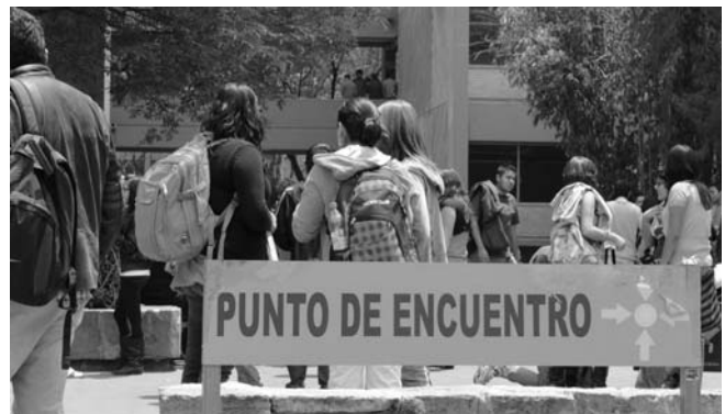
La comunidad se reunió en los puntos de encuentro marcados